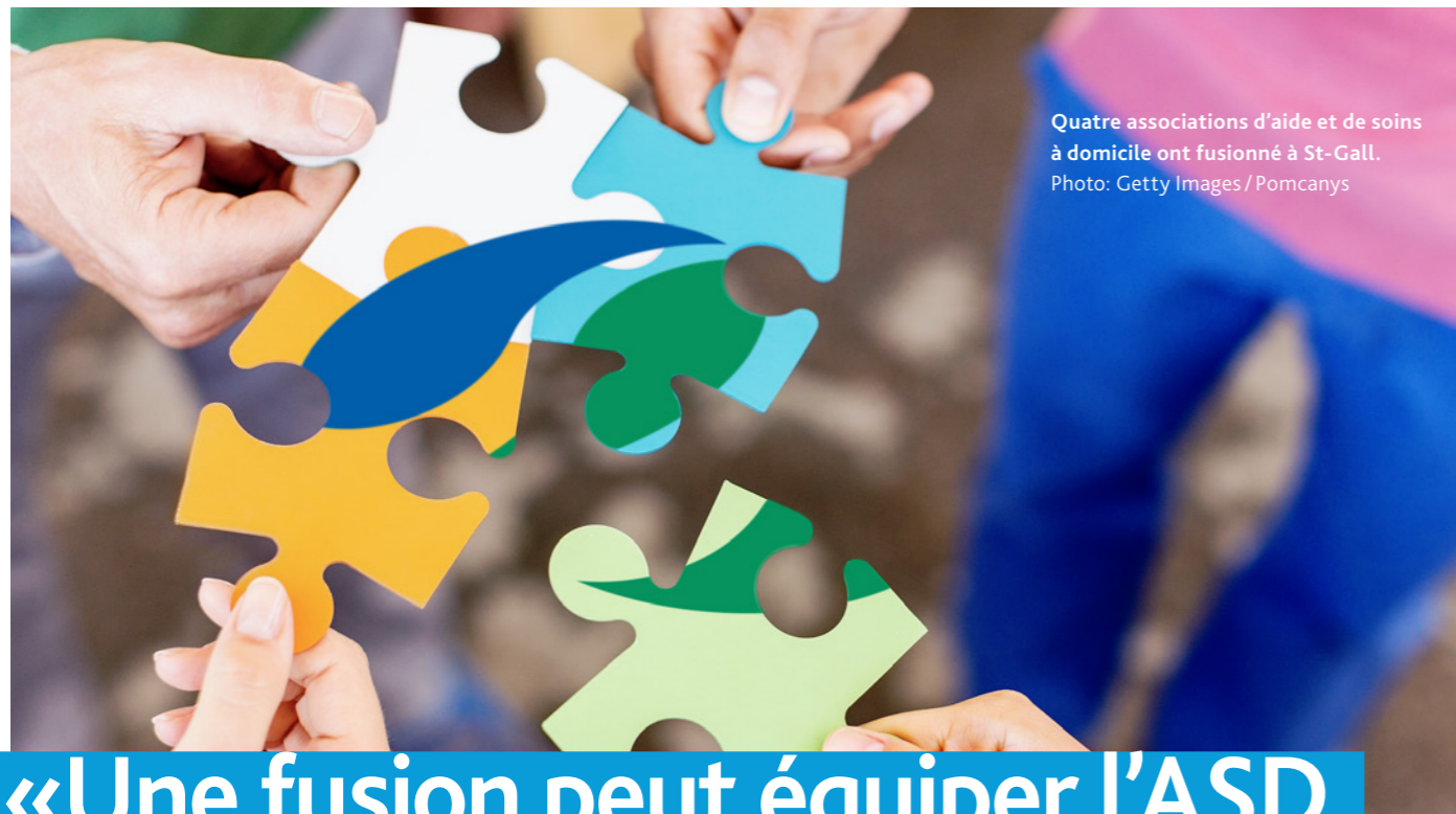
Quatre associations d'aide et de soins à domicile ont fusionné à St-Gall.