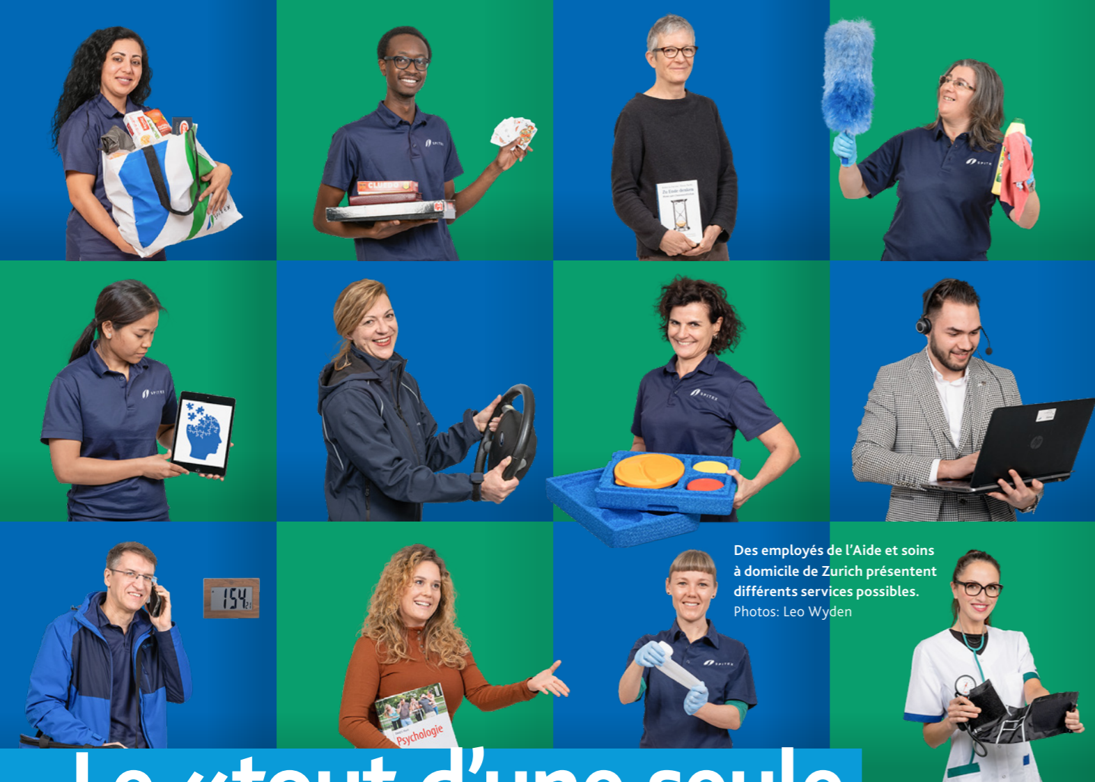
Des employés de l'Aide et soins à domicile de Zurich présentent différents services possibles.