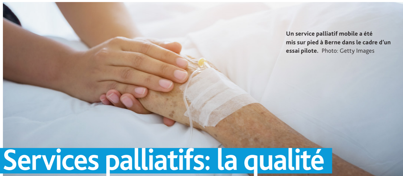
Un service palliatif mobile a été mis sur pied à Berne dans le cadre d'un essai pilote.