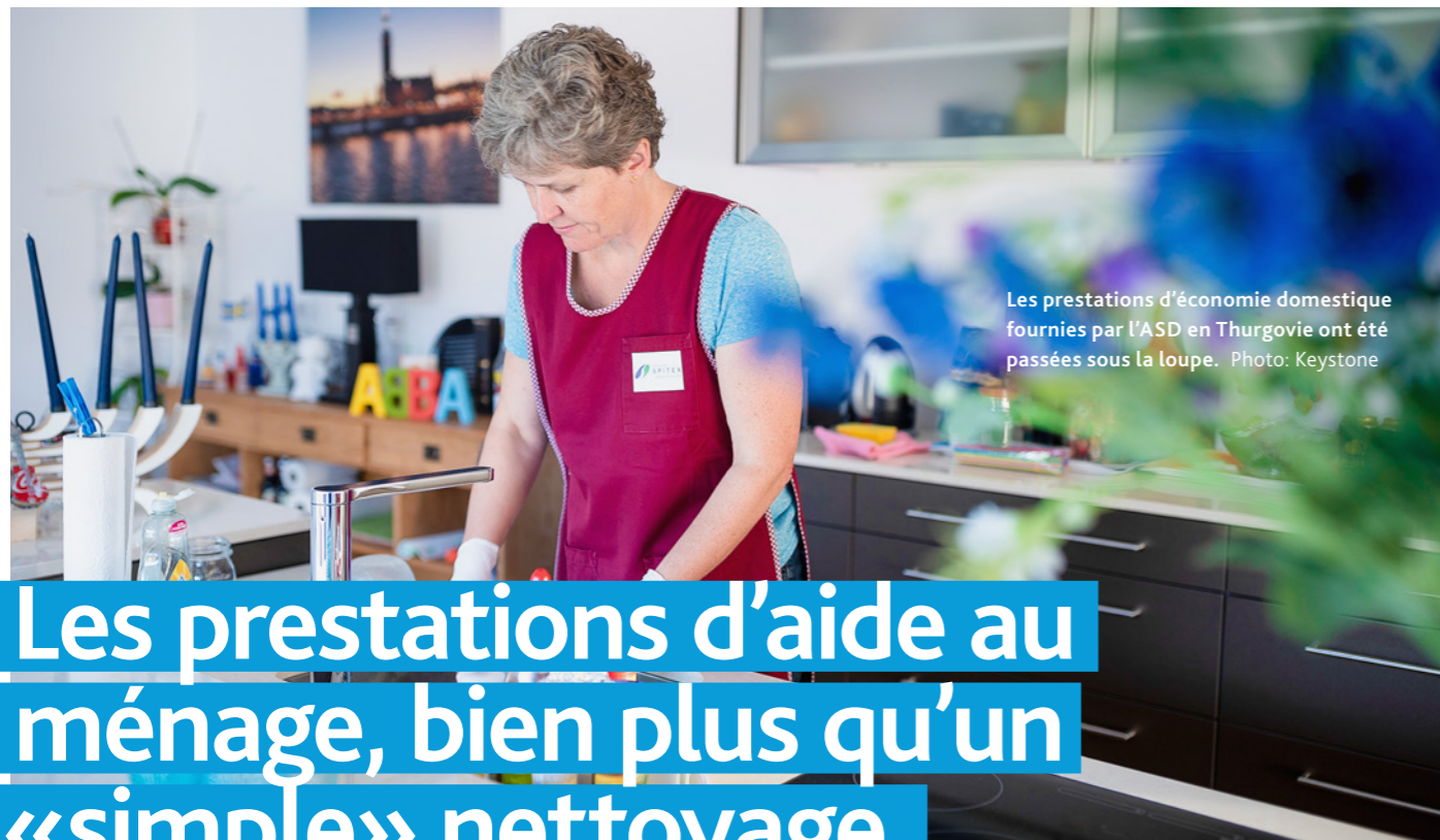
Les prestations d'économie domestique fournies par l'ASD en Thurgovie ont été passées sous la loupe.