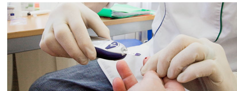
Dietro ogni atto, una persona

Nella pratica quotidiana utilizziamo termini in modo automatico, senza renderci conto di quanto sia importante trovare le parole giuste.