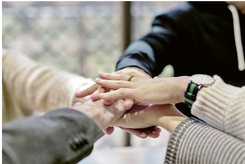
La composition des équipes de soins influence le sentiment de satisfaction de tous les employés.

Par la suite, les informations obtenues permettront de concevoir et d'évaluer des modèles de bonnes pratiques. Elles permettront également d'élaborer des modèles adaptés à la gestion des niveaux de qualification et de la diversité des équipes soignantes. Au final, ces modèles seront mis à disposition des organisations d'Aide et soins à