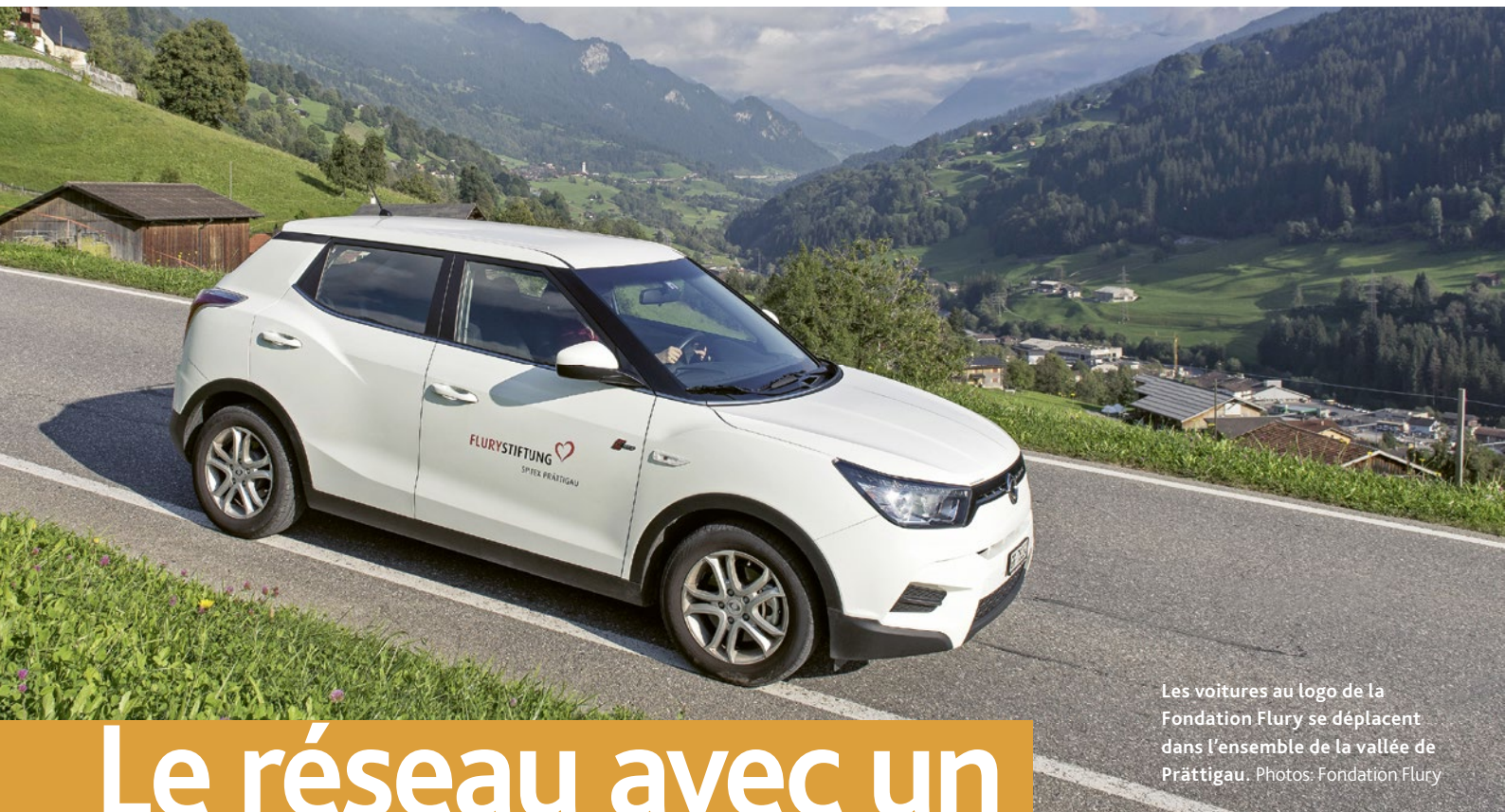
Les voitures au logo de la Fondation Flury se déplacent dans l'ensemble de la vallée de Prättigau.