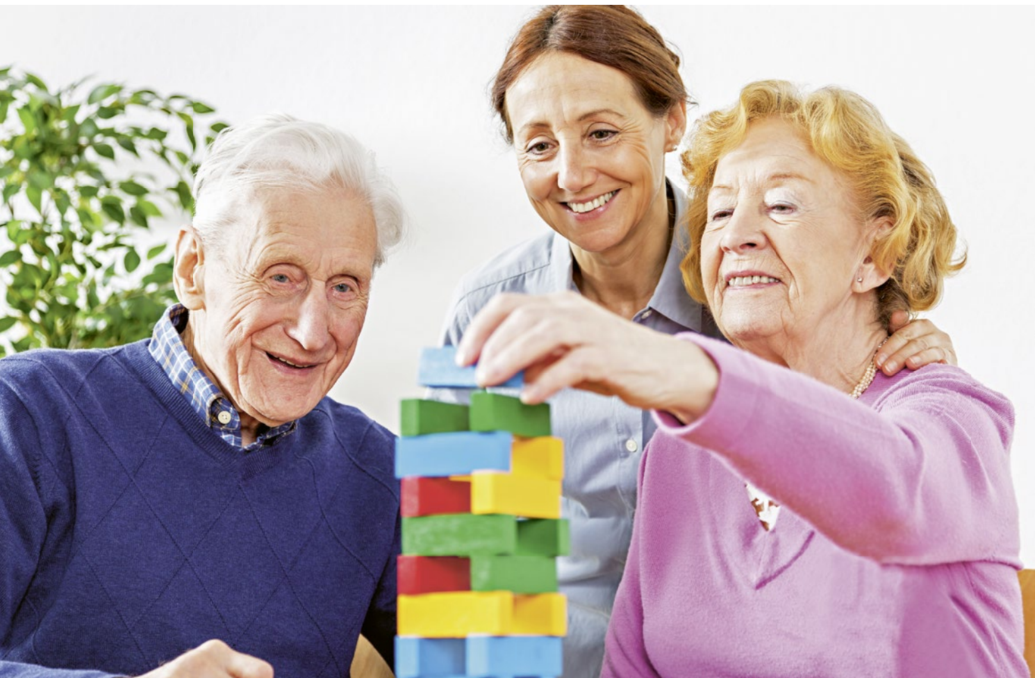
Une conseillère offre son expertise pour former un réseau autour de la personne malade et ses proches.

IT: D'autres outils scientifiques nous aident à prendre des décisions. Au moyen d'un questionnaire, il est possible de cerner ce qui décourage, dérange et pèse sur le quotidien d'un proche aidant. Est-ce le comportement agressif de la personne démente ou alors un manque de temps pour soi? Le proche aidant a-t-il besoin d'un groupe de parole qui puisse lui donner des conseils sur le long terme ou est-ce qu'un soutien et des soins lui sont immédiatement nécessaires?