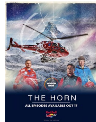
Couverture de la série.