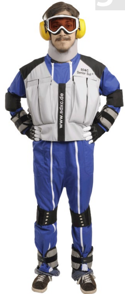
Ce costume simule les effets du vieillissement.

Pour connaître les activités organisées dans votre région, consultez les médias ou les sites internet des services d'ASD locaux.