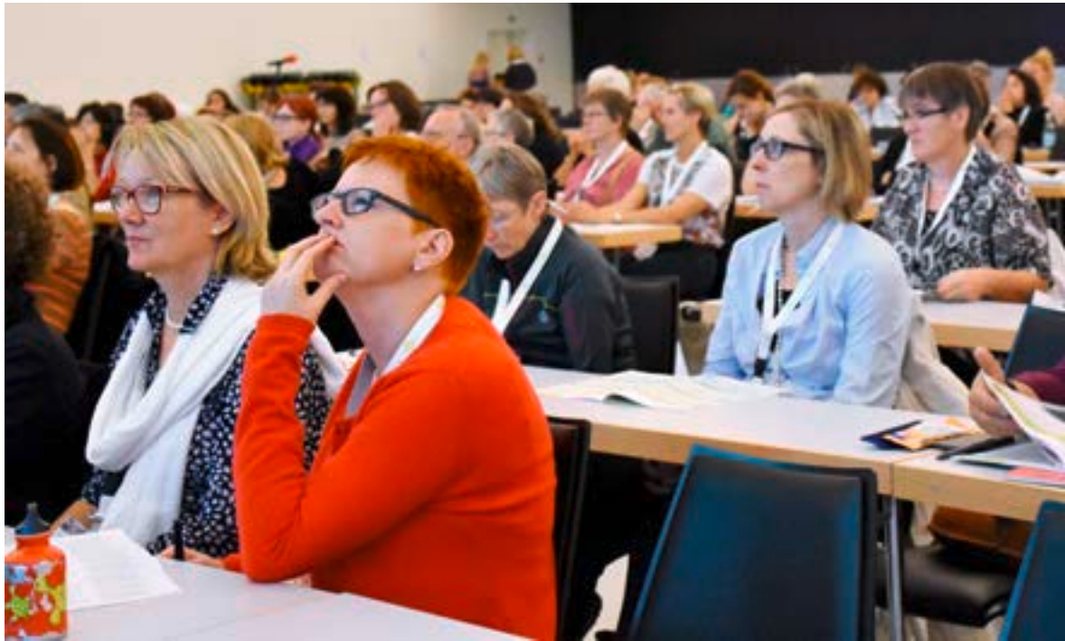
La conférence ASI de cette année était placée sous la devise «Valeurs-Empathie-Flamme»