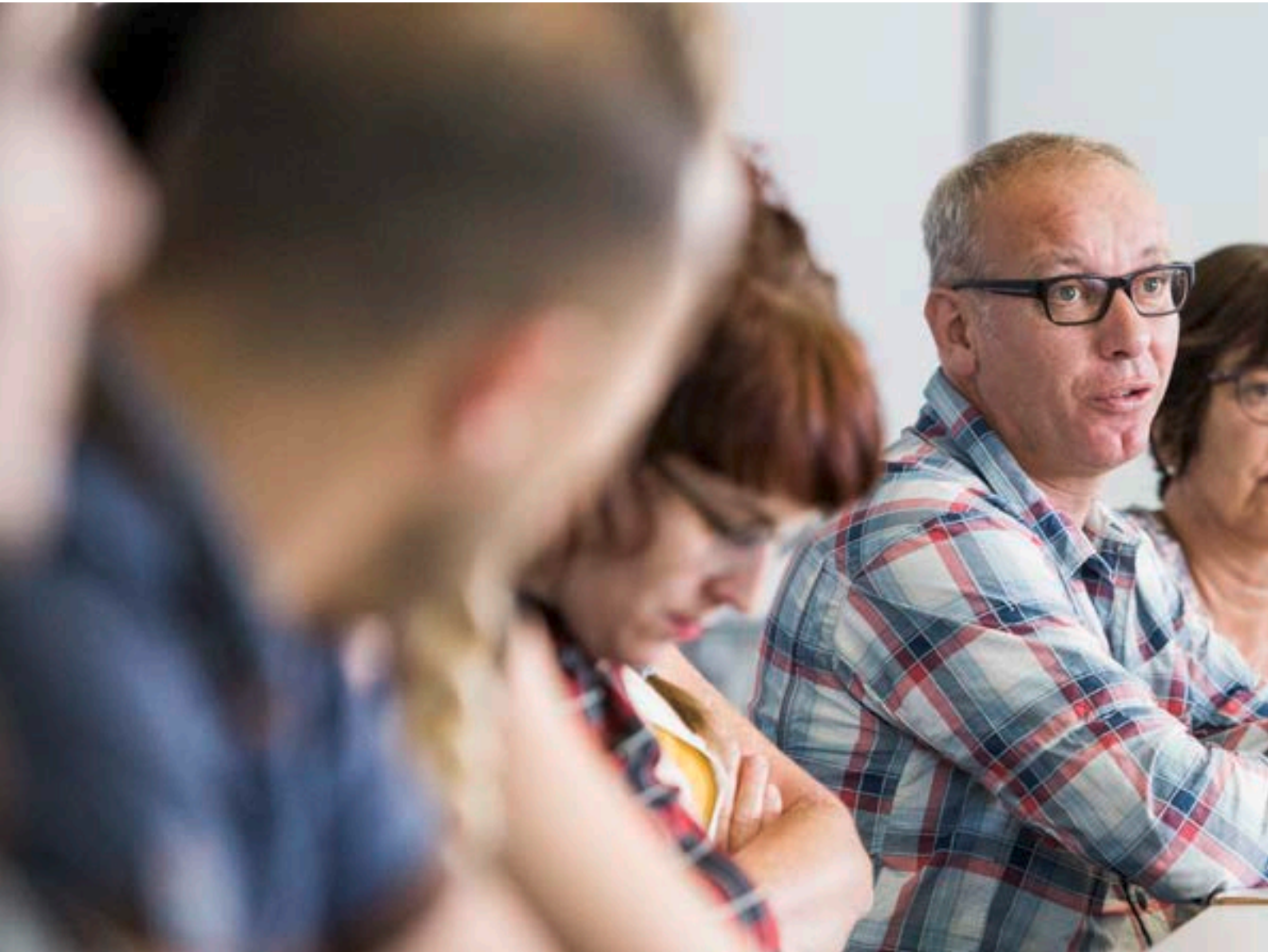
La séance d'accueil des nouveaux collaborateurs imad fait partie des dispositifs de formation et a lieu chaque mois.

tion des ressources humaines et de formation, elle doit pouvoir les intégrer dans la politique cantonale et s'appuyer sur un système de formation réactif», précise, à ce sujet, Sandrine Fellay Morante.