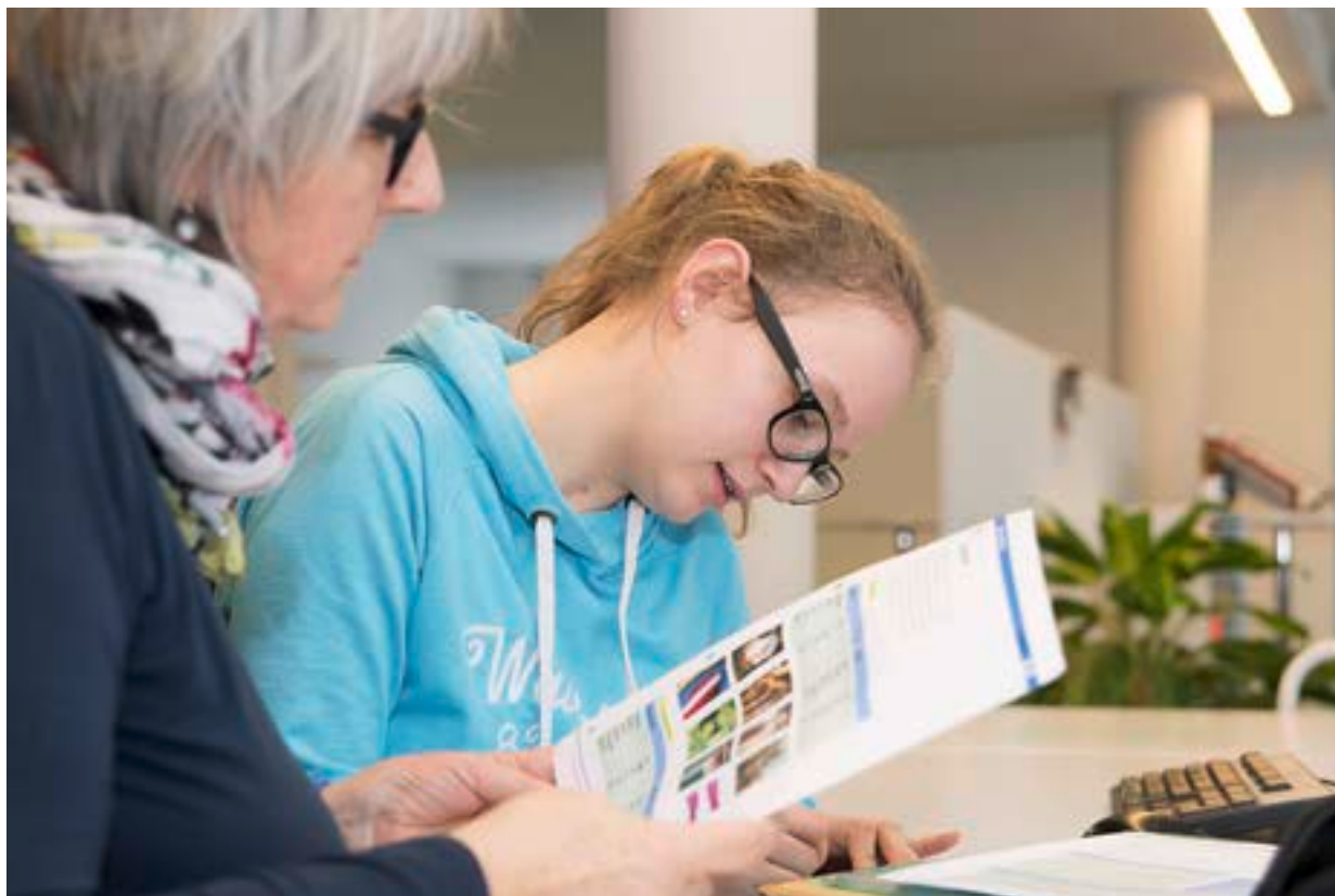
Le «modèle lucernois» fonctionne et crée de l'offre supplémentaire dans le canton.

tions de Spitex et des EMS par les communes. Le modèle se réfère au rapport sur les besoins en effectifs jusqu'en 2020 édité par la Conférence suisse des directrices et directeurs cantonaux de la santé (CDS). Pour Spitex et les EMS, ces chiffres ont été convertis afin de définir la valeur désirée pour 2020. D'après ces calculs, le secteur du maintien à domicile doit offrir annuellement 69 places de formation pour des professionnels des soins ES et HES, dans le Canton, ainsi que 105 places pour des apprentis ASSC. Le nombre de places à créer par chaque établissement dépend des heures de soins OPAS fournies: sur la base des heures de soins OPAS fournies l'année précédente, chaque organisation peut calculer combien de personnes elle doit former par année. Si elle ne forme pas le nombre requis, elle est frappée d'un malus. Dans le cas contraire, elle est créditée d'un bonus. La formation crée des emplois. Un cursus de formation tertiaire demande l'engagement d'une personne responsable de la formation. Cela dépasse clairement les moyens dont disposent les petites structures. C'est alors la personne responsable de la formation au niveau du canton qui s'en chargera. Le groupe de travail cantonal est actuellement en train de réévaluer le modèle. «L'éventualité d'inclure d'autres professions dans le secteur des soins à domicile, est actuellement discutée», précise Tamara Renner.